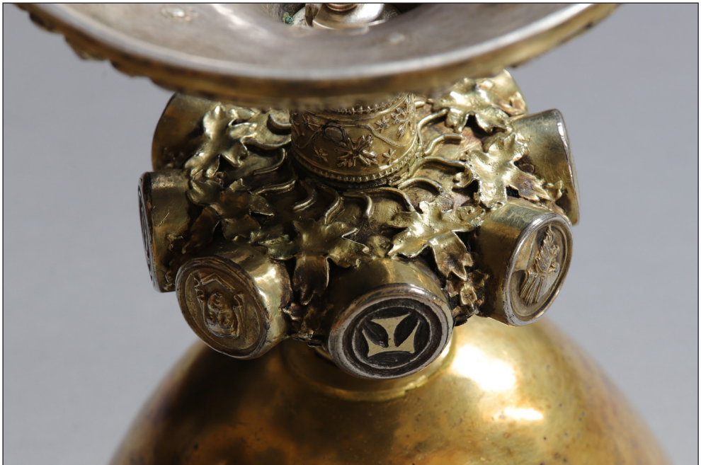
Abb. 6. Die Unterseite des Nodus mit aufgelegten Weinblättern aus aufgelöteten Blechen mit Stielen aus gebogenen Drahtstiften.

Der Nodus des Kelches weist acht zylindrische Rotuli auf. An deren Enden sind im Wechsel kreisförmige Bildmedaillons und farbig hinterlegte gotische Majuskeln angebracht, welche den Namen OTTO ergeben. Auf den Flächen des Nodus ist Blattwerk aus gewölbten Blechen mit Stielen aus Drahtstiften aufgelötet (Abb. 6). Die Segmente des zylindrischen Schaftes ober- und unterhalb des Nodus sind mit wellenförmigen Blattranken dekoriert, die oben und unten von Perlschnüren gerahmt werden. Die Bleche wurden vermutlich als eher gegossenes Dekor um den Schaft gebogen und verlötet 6 .