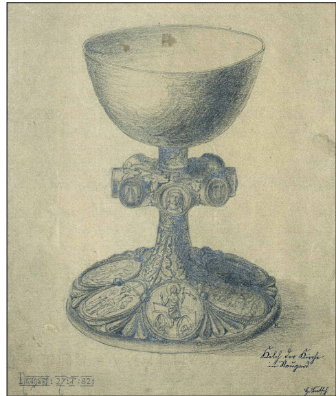
Abb. 3. Hans Lutsch, Zeichnung des Naugarder Kelches, datiert 27.X.(18)82, signiert HL Greifswald, Vorpommersches Landesarchiv, Landeskonservator Bildersammlung 24/10