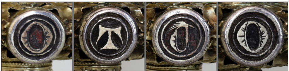
Abb. 17. Nodus, Majuskel-Inschrift O/T/T/O. Fotomontage D. Witt

gekehrt. Der ersten Inaugenscheinnahme / dem Anschein nach könnte es sich bei der fragmentarisch erhaltenen farbigen Masse um eine Art Schellack oder Siegellack handeln, der eingeschmolzen wurde 8 . Der Name Otto ist an dieser Stelle ungewöhnlich. Auf den Knäufen gotischer Kelche befinden sich zumeist die Namen IHESVS und/ oder MARIA (ab der zweiten Hälfte des 14. Jahrhunderts dann zunehmend in gotischen Minuskeln). Hugo Lemcke vermutete in dem Namen Otto einen Stifter aus dem Hause der Grafen von Eberstein (Everstein) Naugard 9 . Hier käme insbesondere der Begründer der Naugarder Grafenlinie, Otto I. von Everstein-Naugard (1266–1313 urkundlich erwähnt) in Frage 10 . Auf ihn und das Geschlecht der Eversteiner soll in einem eigenen Abschnitt weiter unten deshalb ausführlicher eingegangen werden.