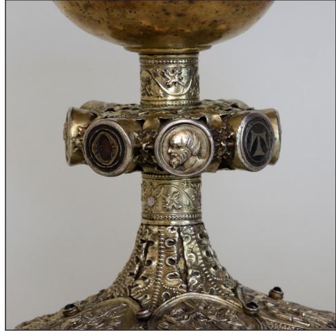
Abb. 16. Nodus, Paulus.

gekehrt. Der ersten Inaugenscheinnahme / dem Anschein nach könnte es sich bei der fragmentarisch erhaltenen farbigen Masse um eine Art Schellack oder Siegellack handeln, der eingeschmolzen wurde 8 . Der Name Otto ist an dieser Stelle ungewöhnlich. Auf den Knäufen gotischer Kelche befinden sich zumeist die Namen IHESVS und/ oder MARIA (ab der zweiten Hälfte des 14. Jahrhunderts dann zunehmend in gotischen Minuskeln). Hugo Lemcke vermutete in dem Namen Otto einen Stifter aus dem Hause der Grafen von Eberstein (Everstein) Naugard 9 . Hier käme insbesondere der Begründer der Naugarder Grafenlinie, Otto I. von Everstein-Naugard (1266–1313 urkundlich erwähnt) in Frage 10 . Auf ihn und das Geschlecht der Eversteiner soll in einem eigenen Abschnitt weiter unten deshalb ausführlicher eingegangen werden.