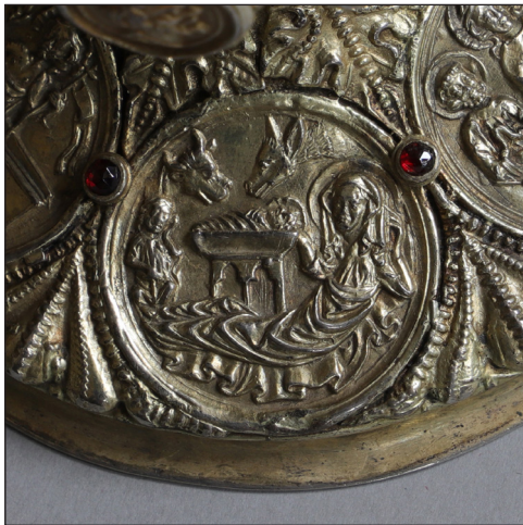
Abb. 7. Geburt Christi.

Die Geburt Christi leitet inhaltlich den Bildzyklus zur Heilsgeschichte ein (Abb. 7). Die Verkündigungsszene, mit der sonst häufig ein christologischer Bildkreis beginnt, ist beim Naugarder Kelch ausgespart. Die Figuren sind sehr ausgewogen in die Kreisform des Medaillons komponiert. Maria ist im Wochenbett liegend mit aufgerichtetem Oberkörper dargestellt. Der sichelförmige Schwung der Figur läuft parallel zur Rahmung des Medaillons. Im Verhältnis zum Unterkörper ist der Kopf Mariens sehr groß gebildet. Sie trägt einen Schleier und ist durch einen großen scheibenförmigen Nimbus ausgezeichnet. Der Saum des Betttuches ist unten ondulierend umgeschlagen und bildet einen Kontrast zu den parallelen Schüsselfalten (des Mantels?), die Maria bedecken. Im Zentrum des Medaillons steht auf einem Unterbau aus zwei Arkaden mit Nonnenkopf-Maßwerk die Krippe mit dem gewickelten Kind. Das Kind wird wie auf einem Altar präsentiert. Diese Assoziation scheint durchaus beabsichtigt. Der Bildtypus mit dem Kind in der Krippe unterscheidet sich von mittelalterlichen Geburtsdarstellungen, bei denen Maria das Kind auf dem Arm hält. Vergleichbare Beispiele finden sich in der Buch- und der Glasmalerei. Der Jesusknabe in der Krippe ist durch einen Kreuznimbus ausgezeichnet. Maria greift mit der linken Hand in Richtung des Kopfes des Kindes. Über die Altar-artige Krippe beugen sich Ochse und Esel. Nur die Hälse und Köpfe der Tiere ragen aus der Umrahmung heraus. Am linken Bildrand sitzt