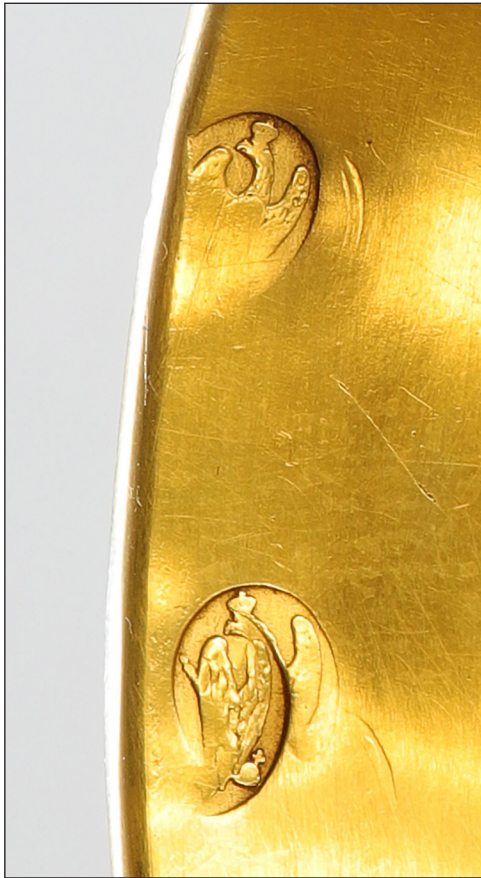
Abb. 19. Preußische Steuerfreimarken (Adler) (1809–1812) auf der Innenseite der Kuppa.

notwendiges Kirchensilber 16 . Hintergrund war die Stempelung und Besteuerung von Gold, Silber und Juwelen in Preußen um die im Friede von Tilsit festgelegten Kriegskontributionen von 120 Millionen Francs (über 32 Millionen Preußische Reichsthaler) an Frankreich aufzubringen. Notwendiges Kirchensilber wurde durch eine Adlermarke als steuerfrei gekennzeichnet 17 .