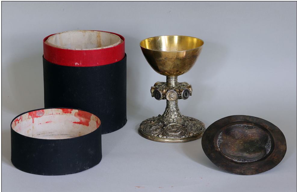
Abb. 1. Der Kelch, die Patene und die zugehörige Pappschachtel, aufgenommen im Konsistorium Greifswald.