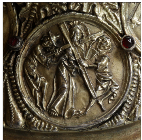
Abb. 10. Kreuztragung.

Auf die Geißelung folgt das Medailon mit der Kreuztragung (Abb. 10). Christus, wiederum ausgezeichnet durch einen Kreuznimbus, hat das im Verhältnis symbolhaft kleine Kreuz geschultert. Sein Gesicht ist dem Betrachter zugewandt. Rechts zerrt ihn ein Büttel vorwärts, hinter ihm, am linken Bildrand, hilft Simon von Cyrene, das Kreuz zu tragen. Simon von Cyrene trägt einen