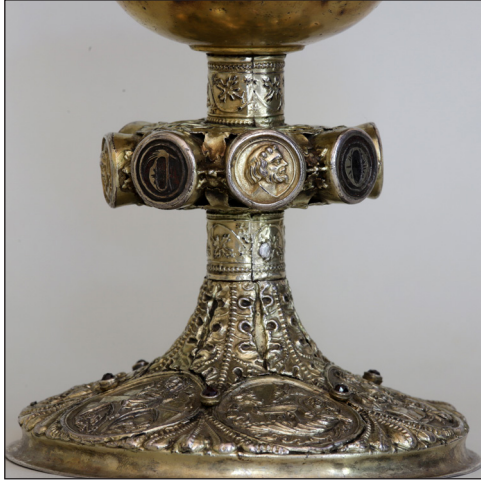
Abb. 15. Nodus, Petrus.