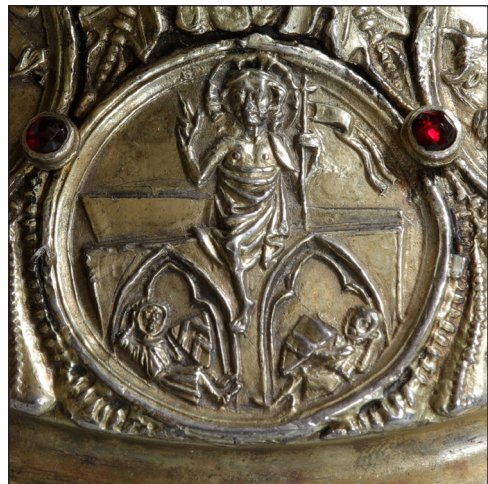
Abb. 12. Auferstehung.