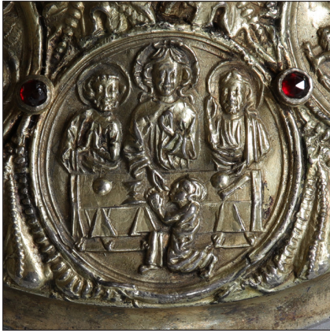
Abb. 8. Abendmahl.