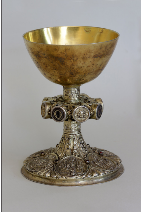
Abb. 4. Der Kelch aus Naugard.

wäre eine tiefgehende kunsttechnologische Untersuchung des Kelches, die bisher noch aussteht.