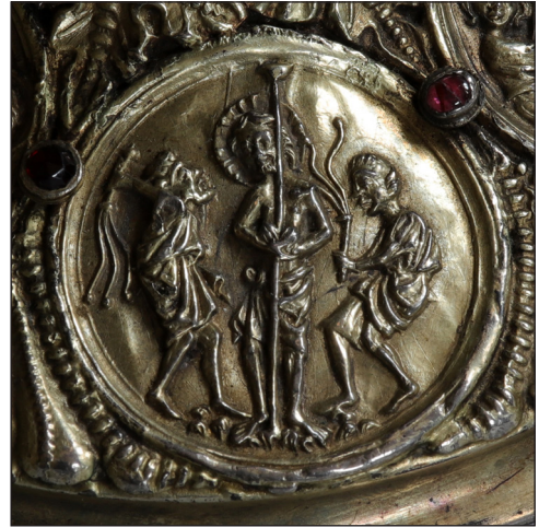
Abb. 9. Geißelung.

Medaillons überschneiden. Der Nimbus der Christusfigur wird durch ein eingeschriebenes Kreuz hervorgehoben. Das Haar Christi ist symmetrisch in Wellen gelegt, wie es typisch für die Bildkunst des 14. Jahrhunderts ist. Der Tisch teilt das Bild in zwei räumliche Ebenen und distanziert Judas von den anderen Gestalten. Dargestellt ist der Moment, in dem Christus dem isoliert vor dem Tisch hockenden Judas den Bissen reicht. Die kleinere Figur des Judas trägt keinen Nimbus.