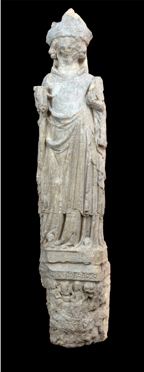
Abb. 21. Skulptur des heiligen Bischofs Otto von Bamberg von der Stettiner Otten-Kirche, Mitte 14. Jh., Muzeum Narodowe w Szczecinie, Inv.-Nr. MNS/Szt/137; Krasnodebska 2022, Kat.-Nr. 3.

In der Sammlung des Nationalmuseums Szczecin wird eine Skulptur des heiligen Otto von Bamberg bewahrt, die nach dem Abriss der Otten-Kirche 1575 im Schloss überdauert hatte 58 (Abb. 21). Als Ersatz ist seit 1934 am Münzturm im Schlosshof eine von Hand des Stettiner Bildhauers Hans von Ruedorffer ergänzte Kopie der Statue angebracht.