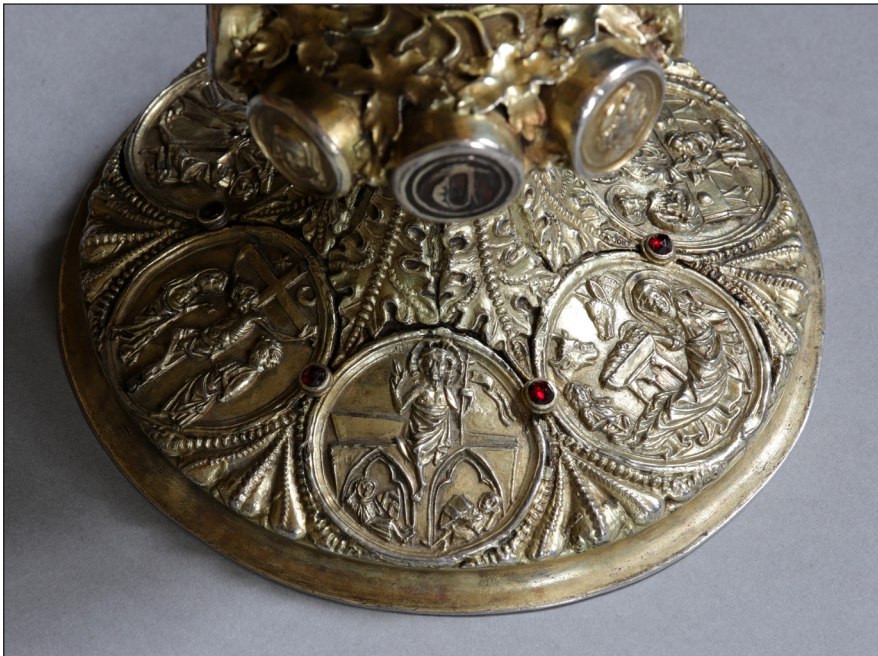
Abb. 5. Der Fuß des Kelches, im Vordergrund das Auferstehungsrelief.

Der Kelch ist sehr aufwändig gestaltet. Auf dem runden Fuß, der eine Zarge mit Hohlkehle aufweist, befinden sich sechs fein modellierte gegossene Medaillons mit Szenen aus dem Leben und der Passion Christi (Abb. 5). Die Bildreihe beginnt mit der Geburt Christi, es folgen die Einsetzung des Abendmahls, weiter die Passion mit Geißelung, Kreuztragung und Kreuzestod. Mit der Auferstehungs-