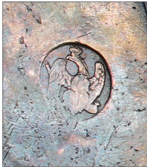
Abb. 20. Preußische Steuerfreimarke (Adler) (1809–1812) auf der Patene.