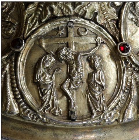
Abb. 11. Kreuzigung.

Mit der Auferstehung Christi schließt sich der Bildkreis (Abb. 12). Christus steigt mit dem rechten Bein aus dem quer im Bild stehenden offenen Sarkophag. Das Haupt