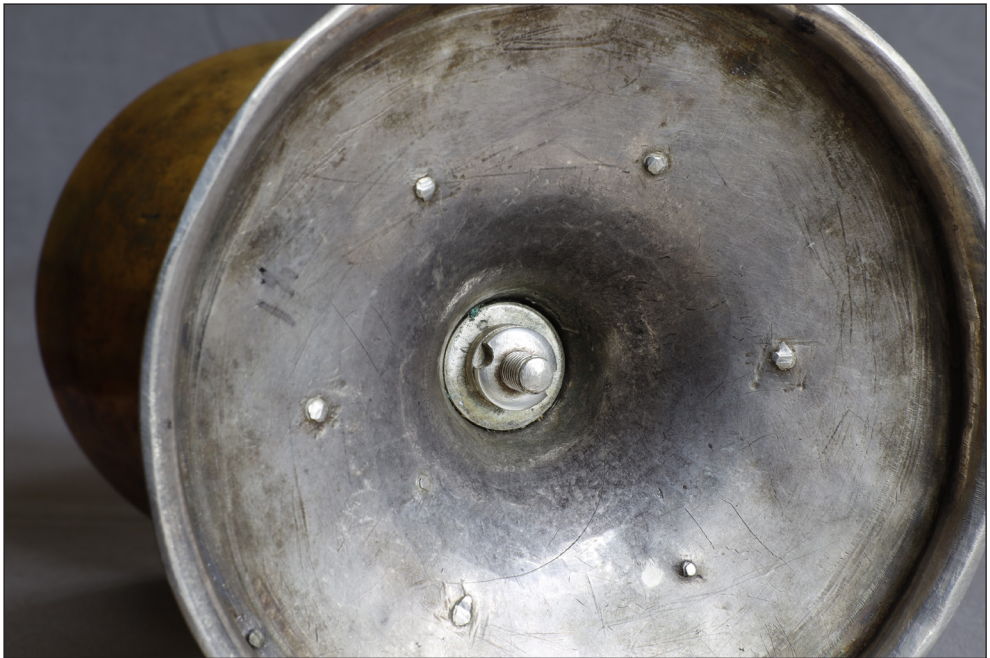
Abb. 18. Unterseite des Kelches mit moderner Schraubverbindung (1930er Jahre?).

Möglicherweise steht die Neuvergoldung der Kuppa im Zusammenhang mit einer Restaurierung bzw. Reparatur. Am Kuppaboden wurde von unten nachträglich ein rundes Blech aufgelötet 14 . Diese Maßnahme könnte mit dem Einbringen einer neuen Schraubverbindung im Schaft in Verbindung stehen. Von unten sind im Schaft zwei Kontermuttern über einer Unterlegscheibe auf einem Gewindebolzen aufgeschraubt, der die Teile des Kelches zusammenhält (Abb. 18). In die Unterlegscheibe sind zwei Sterne sowie Buchstaben (und Zahlen?) eingeschlagen, die sich streichen jedoch nicht vollständig lesbar sind, ohne die Muttern zu lösen. Vermutlich stehen auf einer Seite