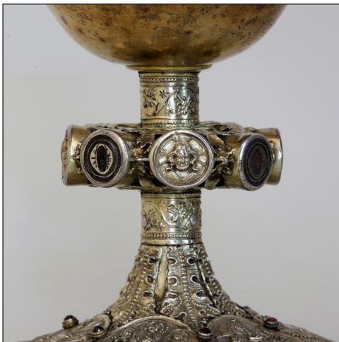
Abb. 13. Nodus, Christus.

Die Majuskeln wurden erhaben aus dem Grund herausgearbeitet und mit farbiger Masse im Wechsel schwarz und rot hinterlegt. Anhand der verbliebenen Reste wird angenommen, dass die rot hinterlegten Buchstaben schwarz umrahmt waren und um-